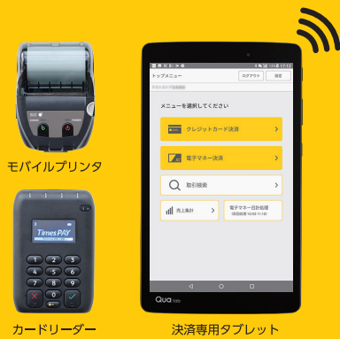
モバイルプリンタ